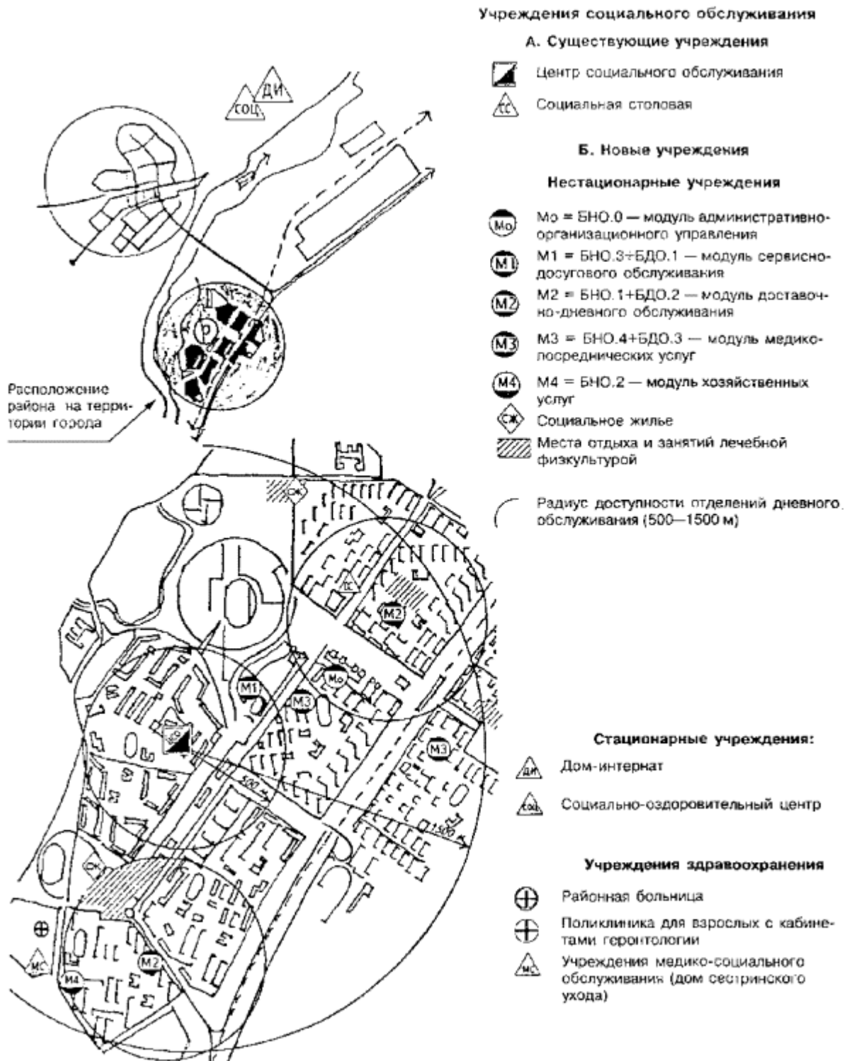
Рисунок 6.2 - Блок-модульный метод размещения учреждений социального обслуживания пожилых людей в сложившемся районе города